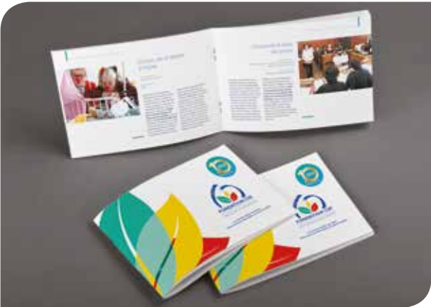
▲ La nouvelle plaquette de la Fondation CSF.

10 ans déjà que la Fondation d’entreprise Crédit Social des Fonctionnaires finance des projets sociaux portés par des fonctionnaires, des administrations, des associations, et accompagne des actions visant à promouvoir le service public (colloques, publications, rencontres...). Cet anniversaire était aussi l’occasion de mettre en avant tous ces projets dans une nouvelle plaquette que votre conseiller se fera un plaisir de vous remettre à votre demande. ■