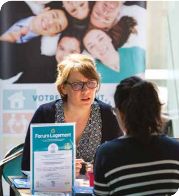
▲ Forum Logement organisé par le CSF au CHU de Clermont-Ferrand.

sont tenues dans différents secteurs de la Fonction publique : ministère des Affaires étrangères, Secrétariat Général de la Défense et de la Sécurité Nationale, Hôpital Rothschild... Si vous souhaitez organiser ce type de Permanence, parlez-en à votre conseiller. ■