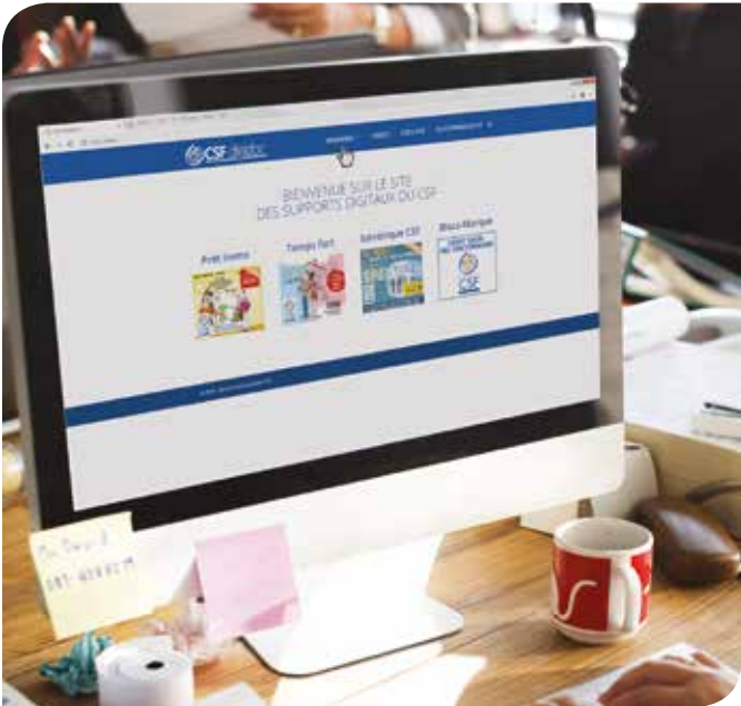
▲ Avec Digidoc, l'administration choisit la bannière du CSF à insérer sur son Intranet.

le service Communication digitale du CSF pourra le renseigner. Ces deux liens urls une fois installés sur l'intranet, il n'y a plus d'interventions à faire . C'est au CSF que s'actualise le visuel et la page d'atterrissage. L'agent bénéficie toujours de l'information à jour. ■