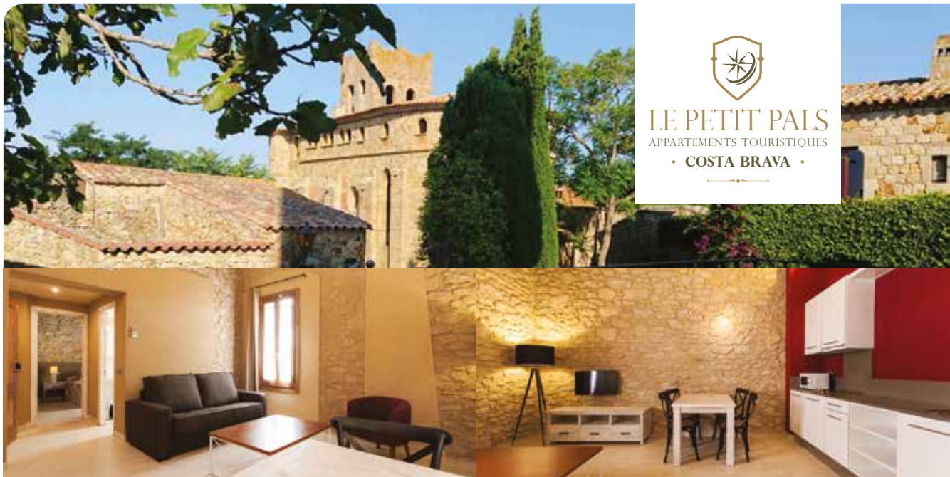
▲ 5 logements, modernes, offrant confort et tranquillité au cœur de la Costa Brava.